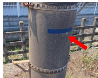
△浸水深マーキング

これにより、従業員が現地にて周辺の浸水レベルを容易に確認できる環境が整備されるほか、今後施設の更新を行う際のかさ上げの目安に活用していきます。