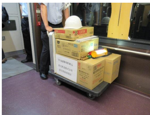
△避難車両への備蓄品の積み込み