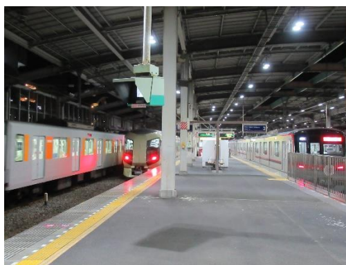
△留置された避難車両