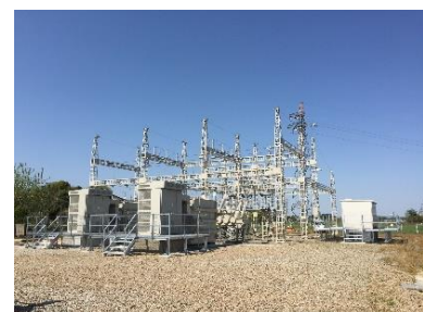
△嵩上げ後の変電所

浸水が想定される場所や実際に浸水した場所の鉄道用変電所について、更新改良工事等の計画にあわせて施設のかさ上げを実施しています。