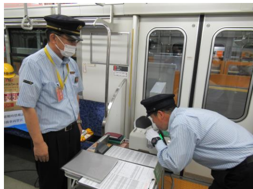
△車内における乗務員のアルコール検査